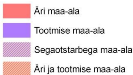
Joonis 2 . Väljavõte koostamisel olevast Rakvere valla üldplaneeringu maakasutuse joonise leppemärkide loetelust

Vastavalt normide lisa 1 tabelile 17 on riigitee liigist (põhimaantee) ning liiklussagedusest tulenevalt vähim lubatud ristmike vaheline kaugus riigitee antud lõigus 500 m, eeldusel, et ristmikuga liituva tee liiklussagedus on üle 20 sõiduki ööpäevas, ning ristmike vahekauguste määramisel arvestatakse mõlemaid sõidusuundi koos.