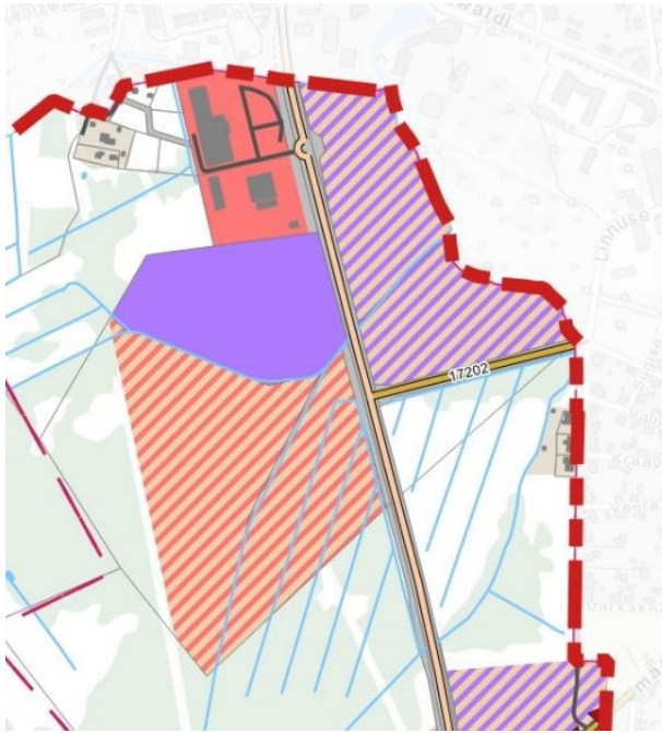
Joonis 1. Väljavõte koostamisel olevast Rakvere valla üldplaneeringu maakasutuse joonisest ( https://www.rakverevald.ee/documents/108618/29856040/Maakasutus.pdf/25c1dbce-f3e2-436e-a506-a535bdf210ed )